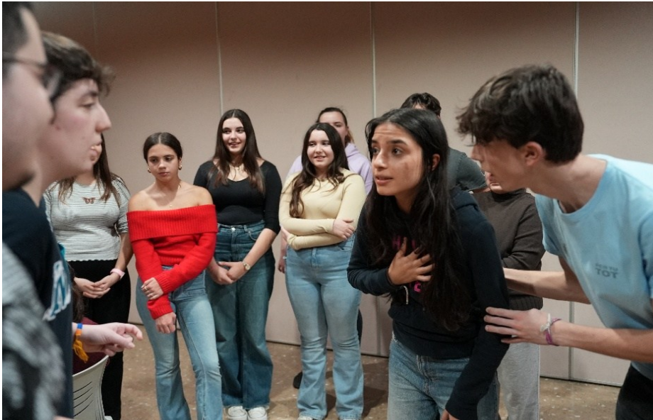
Intervenció artística i comunitària a L'Hospitalet del Llobregat (Temporada 24/25) Dir. PLAUDITE Teatre.