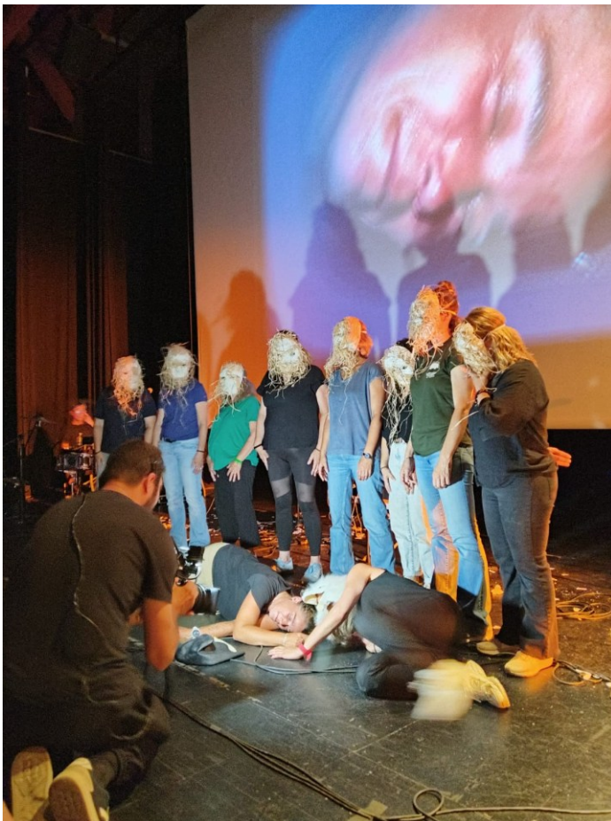
Intervenció artística i comunitària a Premià de Mar (Temporada 24/25). Dir. Juan Navarro.