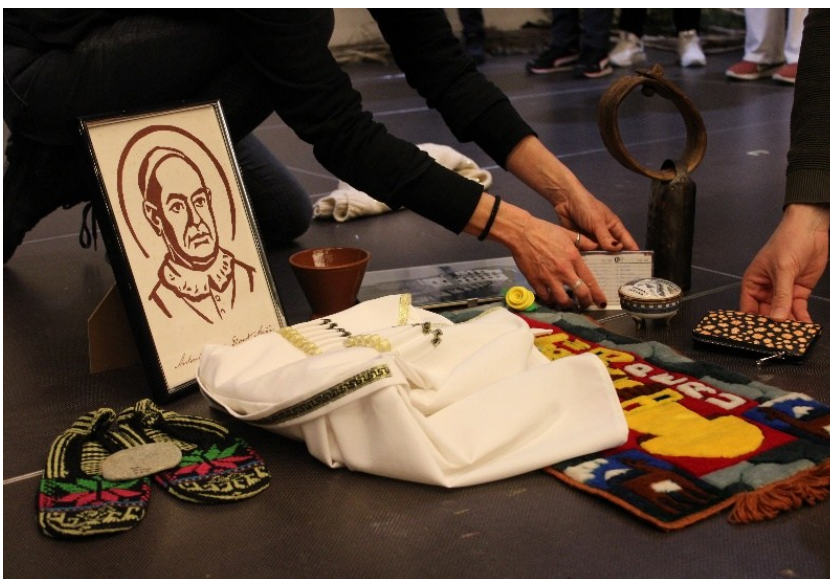
Imatge d'assaig de la intervenció artística comunitària a Sallent, dir. Tàtels Pérez.