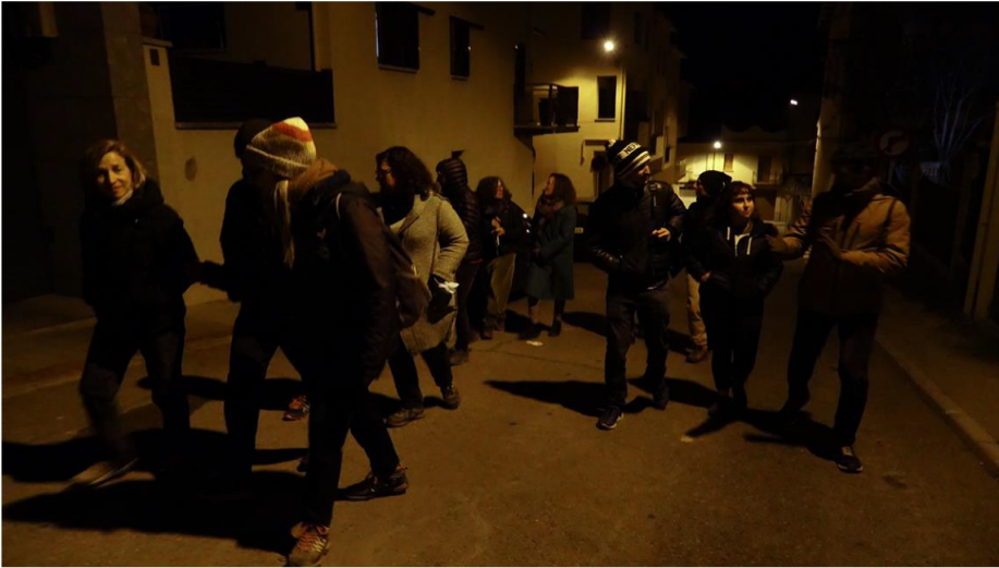
Deriva nocturna a Vic pel 10è aniversari de Deriva Mussol, 2022.