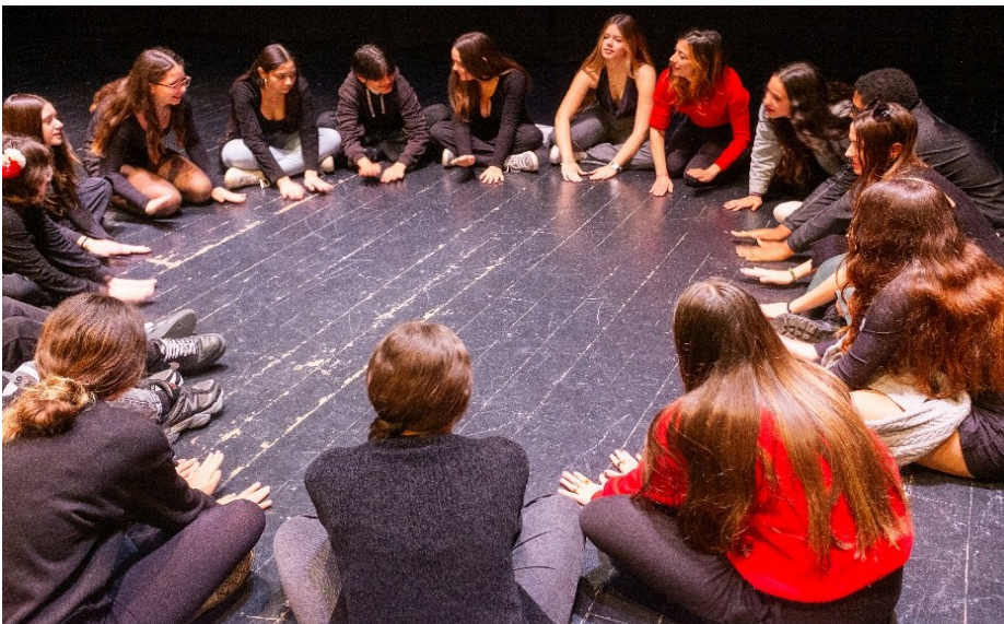
Intervenció artística i comunitària a Vilanova i la Geltrú (Temporada 24/25) Dir. Montse Obrador.

Conspiracions, insurreccions i algunes fantasies heroiques proposa un debat obert sobre les insurreccions, conspiracions i rebel·lions contra els poders fàctics de la societat capitalista actual, i també sobre altres aspectes que ens incomoden o indignen de la societat del segle XXI. Amb aquesta finalitat, el grup es nodreix de la diversitat cultural que conforma el municipi de Premià de Mar per tal d'enriquir la discussió i els punts de vista, i generar un resultat escènic controvertit com el que proposa Manifest Mangione . Conspiracions, insurreccions i algunes fantasies heroiques proposa la creació de relats sobre accions subversives, sabotatges, emboscades... amb la intenció d'alterar l'ordre establert, no des d'una mirada violenta sinó més aviat poètica. Fantasiejar sobre la possibilitat de guarir la nostra indignació envers qüestions que ens envolten i ens molesten. Incidir en aquesta possibilitat de trencar les normes i descobrir com podem traduir aquests relats en pràctica performativa, el joc i l'acció.