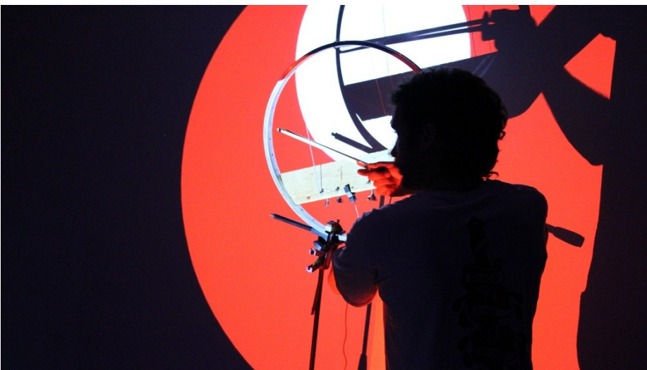
© Marta Galán Sala. Imatge de la intervenció artística i comunitària a Vic (Temporada 24/25) dir. El Refugi (Ramon Furriols, Arnau Musach i Raul Castillo).