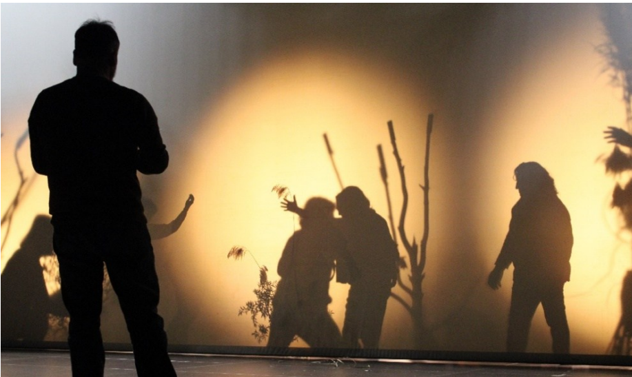
© Marta Galán Sala. Imatge de la intervenció artística i comunitària a Sallent (Temporada 24/25), dir. Tàtels Pérez.